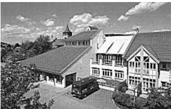
Pflegeheim in Winterbach

Die "erlaufenen Spenden" sollen dazu beitragen, den betroffenen Menschen zu helfen.